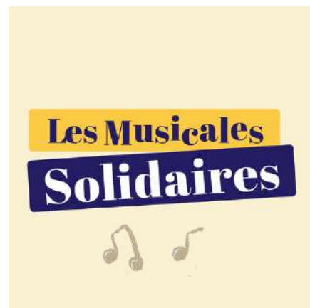
DOSSIER Les Musicales Solidaires