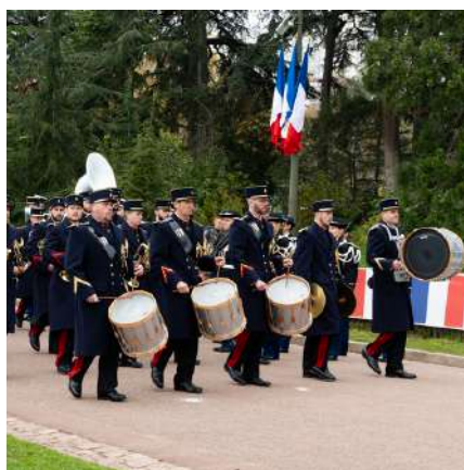
UNITÉ La musique de l'artillerie