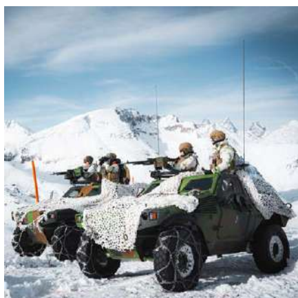
ACTUS Exercice CERCES 2024