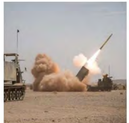
DOSSIER 19 e BART