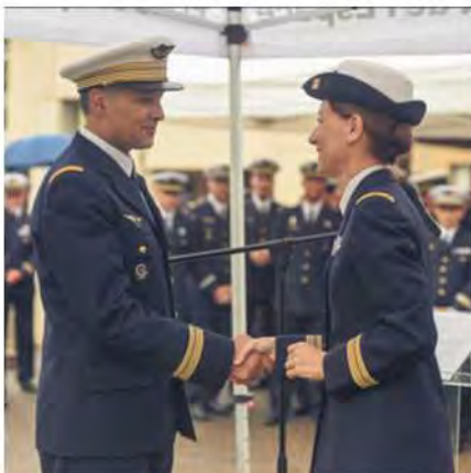
ACTUS La passation à l'EPAE