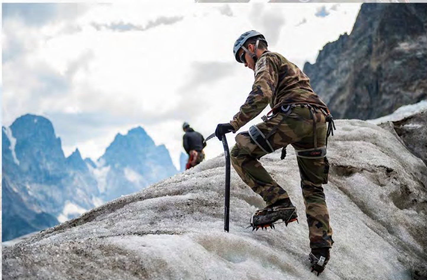
Un militaire du 7 e BCA en pleine ascension lors d'un exercice