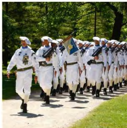
UNITÉ 7 e régiment du matériel